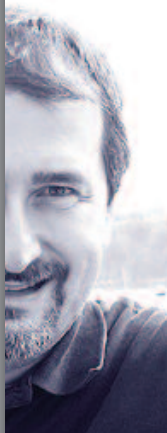
né à Turin, Italie, le 21 octobre 1961, marié, un enfant.

Installé en Bretagne, dans le Morbihan, à Séné, depuis juin 2006